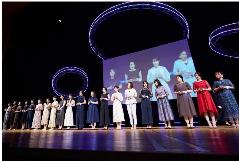
ホワイトエッセンスのCMに出演中ののんさんが登壇し、優秀セラピストに表彰の授与を行っていただきました。

※1: <ホワイトニングについて> 内容: ホワイトニング材とホワイトニング専用照射器を併用して歯を白くします。 / 費用 (自費): 16,500円~107,800円(税込) / 期間・回数: (単品の場合) 1日・1回 (コースの場合) 1~3か月・3~5回 / 副作用・リスク: 個人差がありますが、施術中や施術後に歯がしみる場合があります。 <クリーニングについて> 内容: 歯石取り (スケーリング)、フロッシング、PMTc、舌クリーニングなど / 費用 (自費): 8,800円~42,900円(税込) / 期間、回数: 通常1日、1回 (内容により異なります) 副作用・リスク: 知覚過敏の方は、刺激を感じる場合があります。